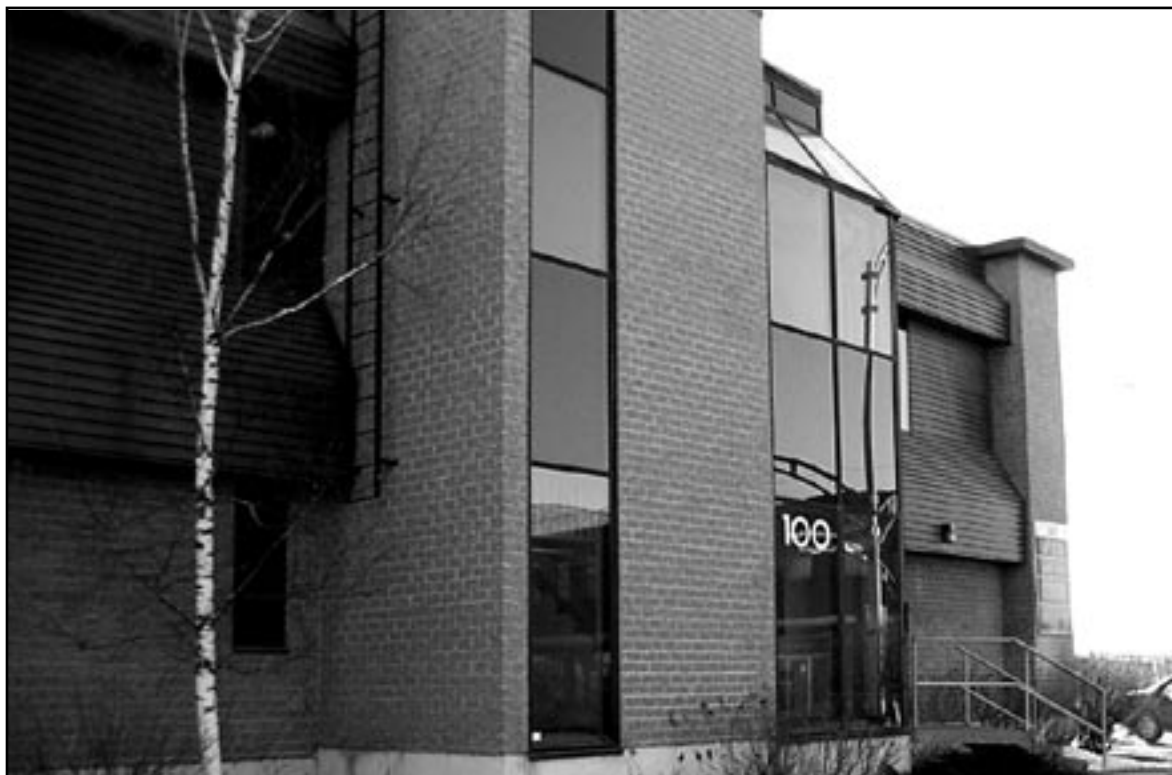
Les bureaux du RPHL à Sherbrooke sont situés dans cet immeuble, rue Belvédère Sud.